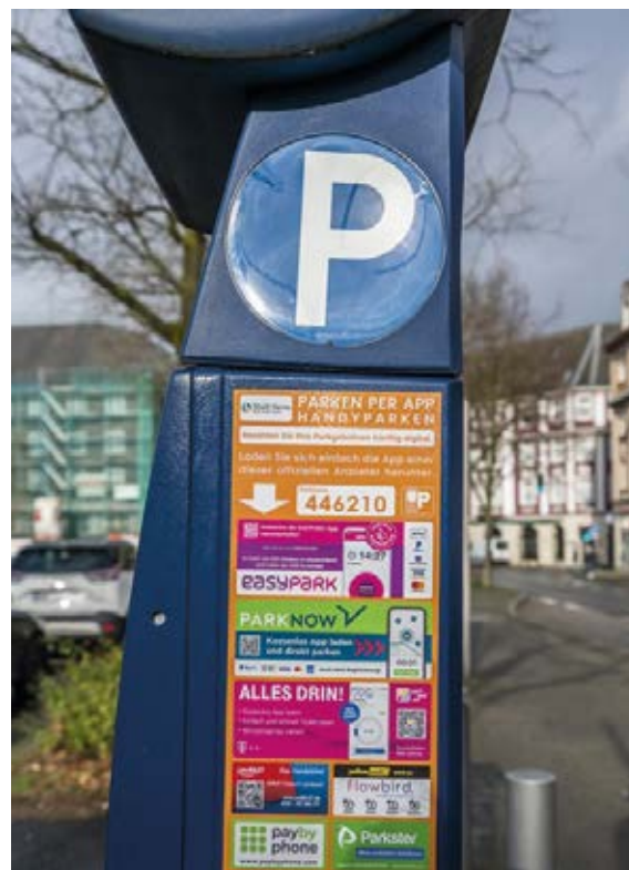
Abb. 1: Parkscheinautomat in Herne, Nordrhein-Westfalen [19]

Die Daten zu den Parkplätzen können auch in Parkraummanagement- und Mobilitätsanwendungen genutzt werden, um eine effektive Verkehrssteuerung und eine optimale Parkraumnutzung zu ermöglichen [23]. Diese verschiedenen Ansätze und Instrumente der Parkraumbewirtschaftung tragen