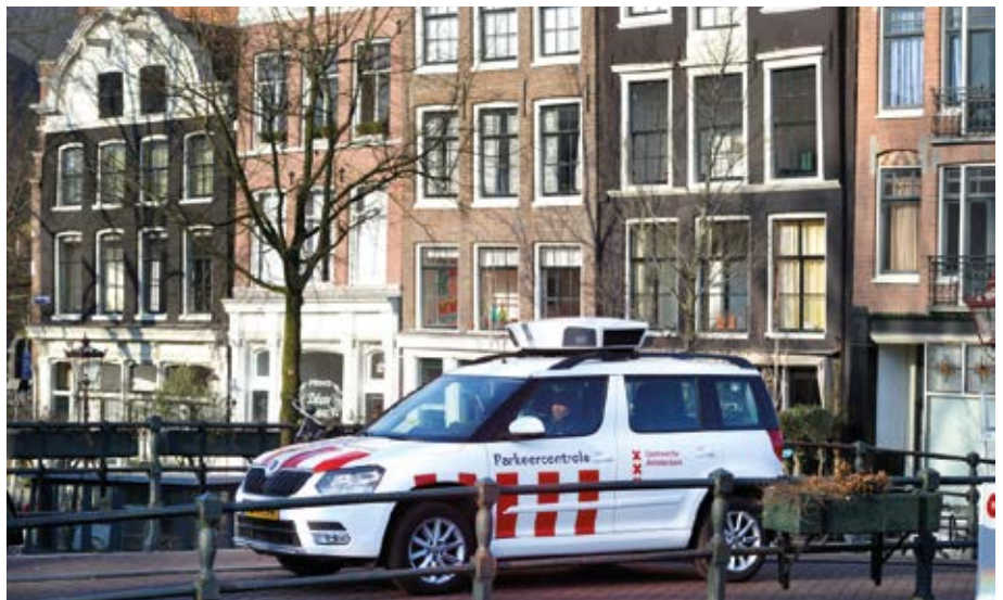
Abb. 2: Niederländisches Scan-Auto in Amsterdam [1]