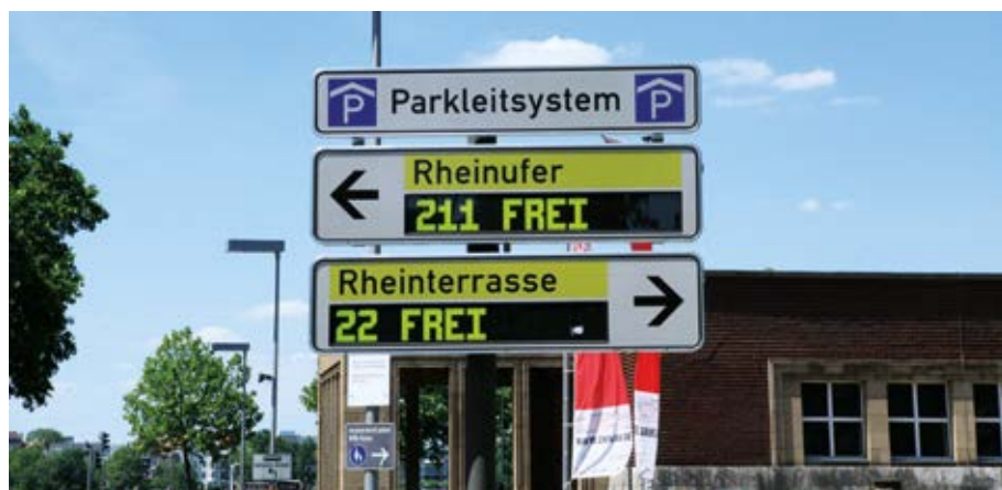
Parkleitsystem Düsseldorf [26]

zu einer effizienten Parkraumnutzung und einem besseren Verkehrsfluss in städtischen Gebieten bei. Bemerkenswert ist, dass die Auswirkungen der Pandemie der Coronavirus-Krankheit 2019 (COVID-19) und der Digitalisierung zu erheblichen Verschiebungen in der Parkraumbewirtschaftung geführt haben. Während der Bedarf an Parkplätzen in der Nähe von Arbeitsplätzen aufgrund von Fernarbeit abnimmt, steigt die Nachfrage nach Parkplätzen in Wohngebieten. Vor allem das Wohnen in Mittel- und Kleinstädten ist attraktiver geworden, was die Nachfrage nach Parkraum in diesen Gebieten erhöht [9]. Die zunehmende